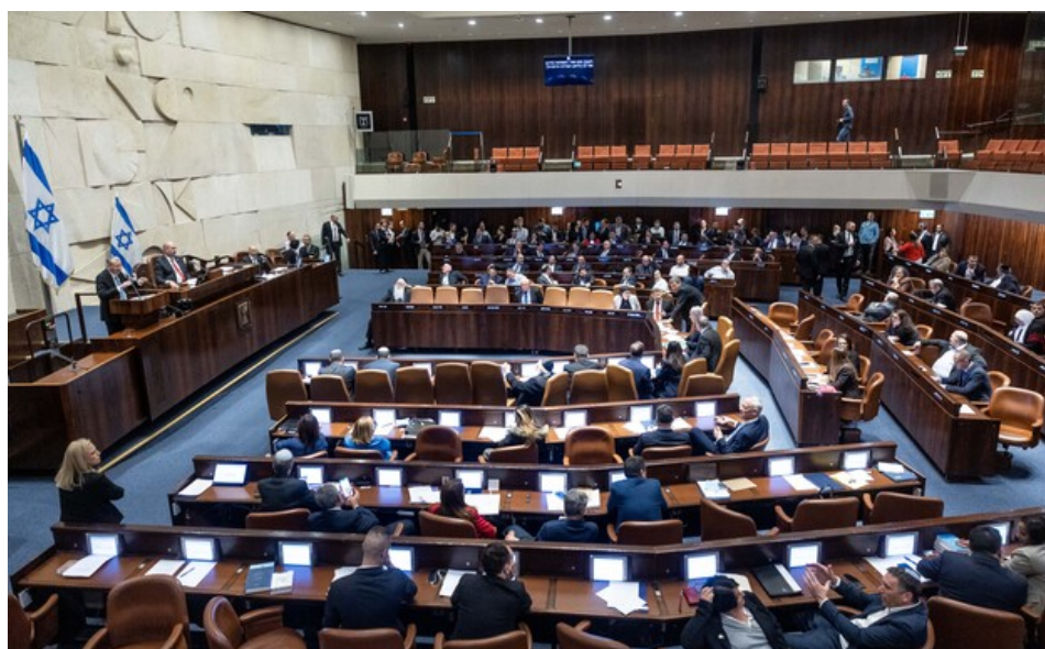
הרב הדתי ישנה את אופייה של המדינה, מליאת הכנסת

במקביל, מתחולל בישראל תהליך ארוך-טווח של עלייה בכוחן של קבוצות המבקשות להפוך אותה למדינת הלכה. קבוצה אחת היא החרדים, 12% מאוכלוסיית ישראל. קבוצה אחרת היא הדתיים הלאומיים, בעלת גודל דומה בהערכה שמרנית. ייצוגן הישיר בכנסת הינו כעת 32 ח"כים, ביטוי ל-25% מהאוכלוסייה שהצביעו לשלוש המפלגות הרלוונטיות. משקלן הדמוגרפי של קבוצות אלו צפוי לעלות. די להביט בנתוני ההצבעה בירושלים, עיר המנבאת היטב מגמות ארוכות-טווח בישראל, כדי להבין כיצד יראה העתיד הלא רחוק: מפלגות אלו קיבלו 56% מקולות הבוחרים ב-1 נובמבר 2022.