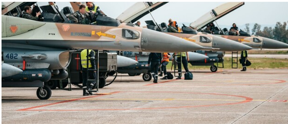
מדינה לא דמוקרטית תקבל אור ירוק לתקיפה? (ארכיון)

כפועל ישיר של ההפיכה המשטרית המתגבשת, סביר לצפות למציאות חדשה במזרח התיכון. זו תאופיין במדינת ישראל מוחלשת אך תוקפנית, שתימצא במאזן אימה מול איראן גרעינית. כעת מתרחשת הידברות בנוגע לחקיקה על מערכת המשפט ותסריט זה עשוי להשתנות, אך חשוב כפליים להבינו בהקשר של הידברות הזו.