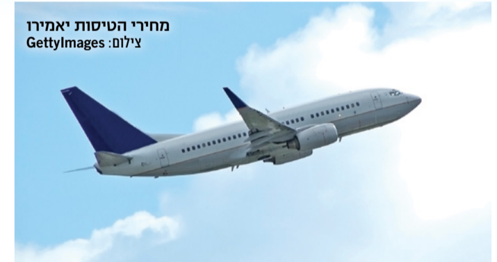
מחירי הטיסות יאמירו