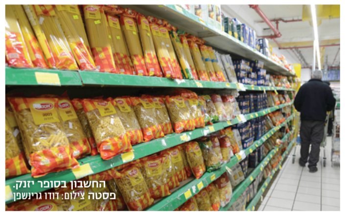
החשבון בסופר יזנק: פסטה